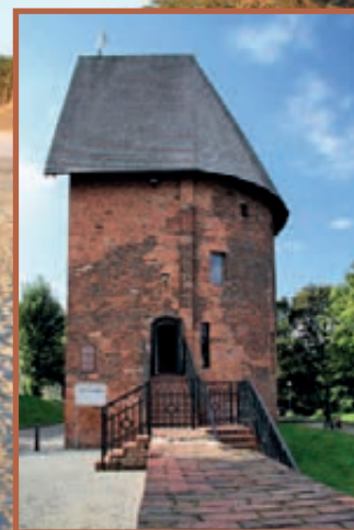
▲ Baszta czarownic